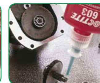
Loctite® 603 (vylepšený Loctite® 601)

P1 NSF reg. č.: 123010 Certifikát DVGW (EN 751-1): NG-5146AR0619 Certifikát WRC (BS 6920): 0511518 Certifikát KTW pre pitnú vodu