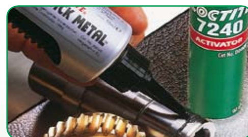
Loctite® 660 (s aktivátorom Loctite® 7649)