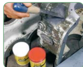
Loctite® Hysol® 3471 A&B

Loctite® 3463 Oceľovým práškom plnená tvarovateľná tyčinka • Čas spracovateľnosti 3 minúty • Čas tuhnutia je 10 minút Ďalšie informácie pozri na strane 41