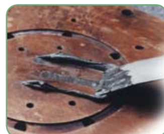
Loctite® Hysol® 3473 A&B