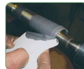
Loctite® Hysol® 3478 A&B