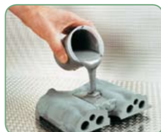
Loctite® Hysol® 3472 A&B