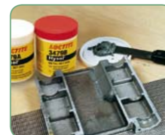
Loctite® Hysol® 3479 A&B