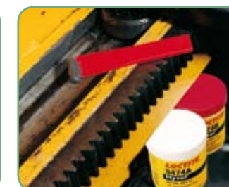
Loctite® Hysol® 3474 A&B