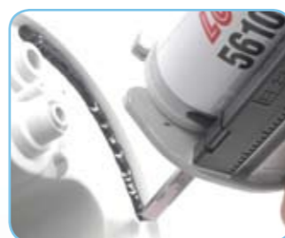
Loctite® 5610 A&B