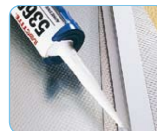
Loctite® 5366 / 5367 / 5368