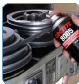
Loctite® 8005 Adhézný sprej na remene