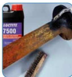
Loctite® 7500 Odhrdzovač